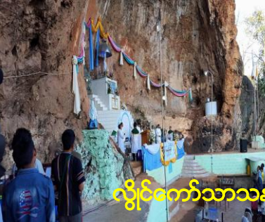
လွိုင်ကော်သာသနာ ယူဆိုမိုဆို မယ်တော်ပွဲ