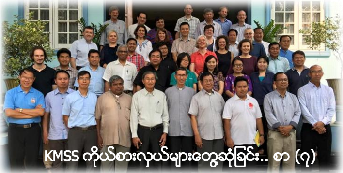
KMSS ကိုယ်စားလှယ်များတွေ့ဆုံခြင်း.. စာ (၇)