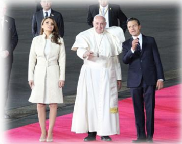
ရဟန်းမင်းကြီးကို မတ္တုဆီကို နိုင်ငံတစ်ဝှမ်းမှ ဘုရားဖူး ပရိတ်သတ်များကကြိုဆို.. (စာ-၂)