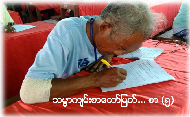
သမ္မာကျမ်းစာတော်မြတ်... စာ (၅)