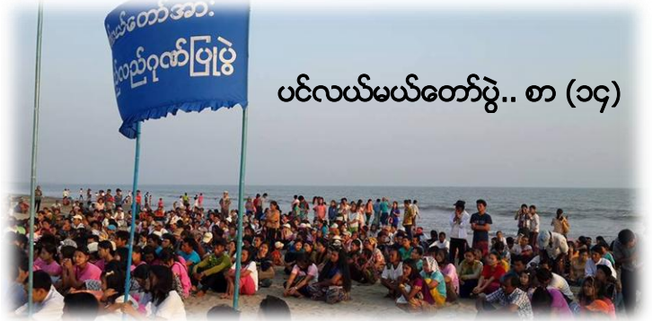
ပင်လယ်မယ်တော်ပွဲ.. စာ (၁၄)