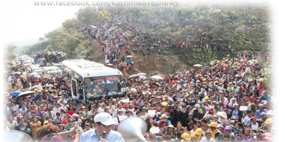
ကချင်ပြည်နယ်မူးယစ်အန္တရာယ်.. စာ (၃)