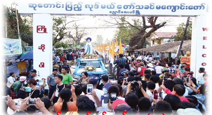
ညောင်လေးပင်မယ်တော်.. စာ(၁၂)