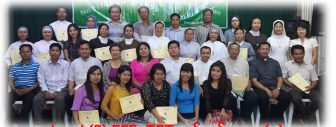
Level (2) ECE- TOT သင်တန်း.. စာ (၈)