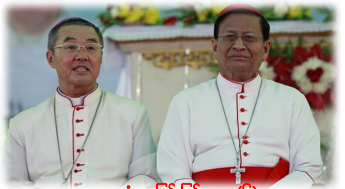
တွေ့ဆုံမေးမြန်းခြင်း... စာ(၆)