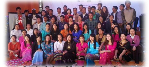
လူမှုကွဲမ်းပင်ရင်းနီးပေါင်းစပ်မှုသင်တန်း.. စာ(၇)