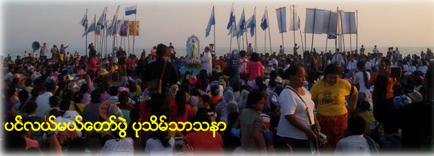
ပင်လယ်မယ်တော်ပွဲ ပုသိမ်သာသနာ