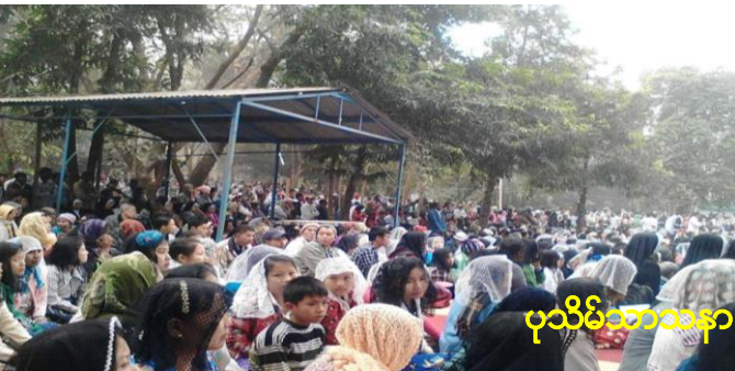
ပုသိမ်သာသနာ Mary Land မယ်တော်ပွဲ