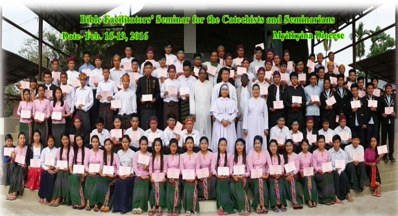
Bible Facilitators' Seminar for the Catechists and Seminarians Date- Feb. 15-19, 2016 Myitthaingyi Diocese